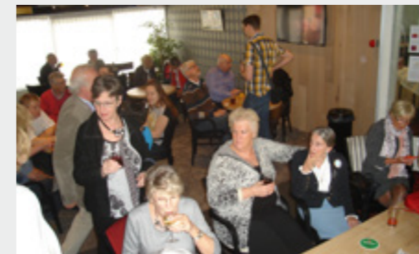
In de bar mooi aangekleed op het feest

Zo'n vrijwilligersfeest is ook niet alles. Als je niet oppast word je er doodmoe van. Je moet er mooier uitgedost heen dan anders, dat vind ik ten minste.