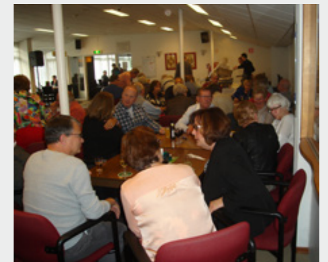
Pais en vree

Goed, maar het begon dus echt met drinken. Daartoe waren schenkdamen aanwezig. Daarbij verzamelde zich een ieder in de bar. Een zeer bekende schenk-dame schonk niet, maar stortte zich na het indrinken in de bar in het bridge met een geweldige partner.