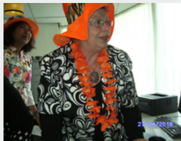
Hoeden en leiding

Twee leden meenden nog dat het volkslied gezongen zou worden en hadden dat dan ook op hun rug geschreven voor hun achterbuurman waarschijnlijk.