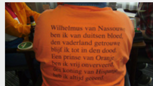
Vers 1 van het Wilhelmus. Slechts één fout.

Twee leden meenden nog dat het volkslied gezongen zou worden en hadden dat dan ook op hun rug geschreven voor hun achterbuurman waarschijnlijk.