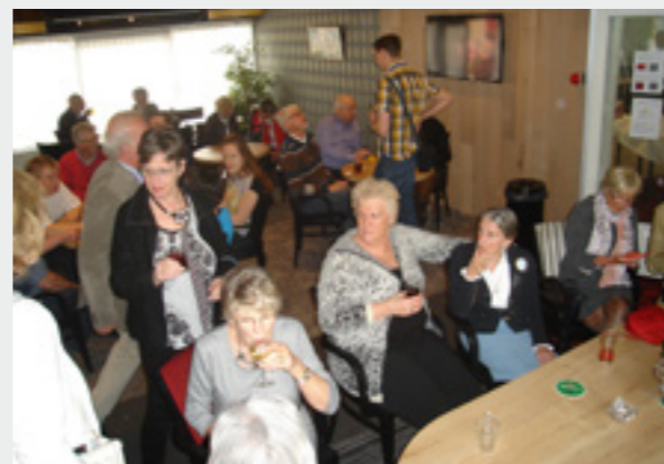
Proost: Leve de Koning

Op Koningsdag hebben we met een bar vol drinkers en een zaal vol bridgers uitbundig oranjebitter gedronken en gebridged.