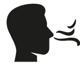
Reuk- en/of smaak- verlies

Heb je op dit moment een huisgenoot met milde klachten en koorts en/of benaauwdheid?