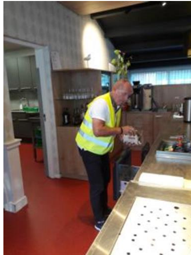
BC: Verantwoordelijk met hes. Hij bewaakt de Coronaregels. Hij verzamelt ook de vaat die gedeponerd moet worden op drie daarvoor klaar staande tafels.