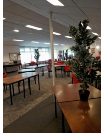
Zaal met tafels als looplijnen

Toen kwam 2 juli het bericht dat de 1.50 m afstand ook aan de tafeltjes gegarandeerd moest zijn. Weer de zaal ombouwen, nu met vier tafeltjes tegen elkaar. Het resultaat was een ruime zaal, die op maandag 6 juli werd ingewijd met een keur aan spelers, waarvan een groot aantal uit de vrijwilligers kwamen.