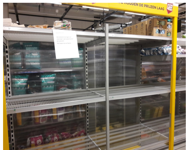
run op toiletpapier