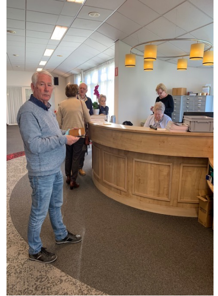
Verbazing en teleurstelling bij de laatste speelmiddag donderdagmiddag bij Jeanne

Ook de pensioenen zullen onder alle sluitingen lijden. De rente was al bijna nul tot negatief, nu komt erbij, dat de beleggingsresultaten, nu de beurswaarde sterk is gedaald, geen compensatie voor het rendement van de fondsen zullen bieden, in tegenstelling tot afgelopen jaren. Wel een reden om onze club met zijn lage barprijzen open te houden. Want echt bridgen is – met een uitzondering voor de doorzakkers op dinsdag- avond een goedkope sport. En clubbijeenkomsten zijn een medicijn tegen de eenzaamheid, nu de mensen in het algemeen en de leden in het bijzonder gedwongen thuis moeten blijven.